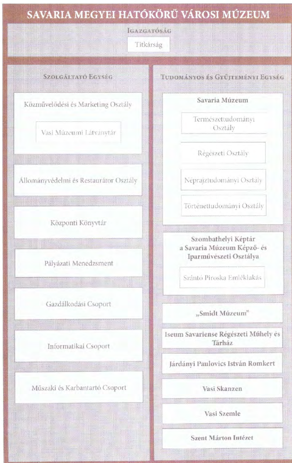
1. ábra: A Savaria Megyei Hatókörű Városi Múzeum szervezeti fő- és alegységei